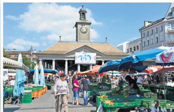
Les Marchés folkloriques veveysans. Ici en août 2013, n'auraient plus forcément lieu seulement en juillet et en août. CH. BRUN